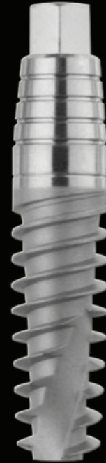
IMPIANTO INTEGRALE: carico immediato