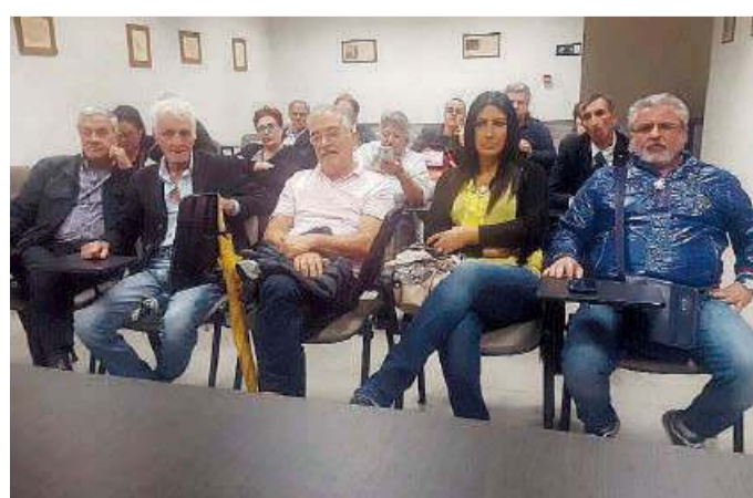
L'incontro. Alcuni esponenti dei diversi comitati civici presenti alla riunione