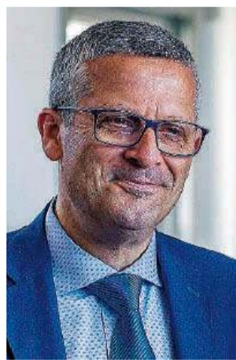
Il questore. Giancarlo Conticchio

Questa mattina, alle 10, il questore, Giancarlo Conticchio, incontrerà la stampa nella sala riunioni della Questura. Nel corso dell'incontro verrà illustrata l'attività dei vari uffici della polizia in tutta la provincia con i risultati conseguiti in estate. Domani, invece, a Cariati verrà celebrato San Michele Arcangelo, Patrono della polizia. A tal proposito l'ufficio Relazioni esterne ha organizzato l'evento inserendolo nel quadro delle attività finalizzate a divulgare la cultura della lega-