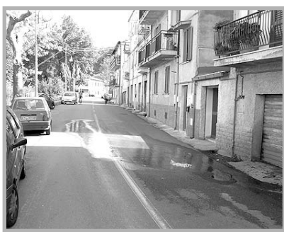
Corso Vittorio Emanuele II

Gli abitanti della zona lamentano un atteggiamento molto irresponsabile degli amministratori attuali, i quali da un po' di anni a questa parte, in tutta l'area urbana della città vecchia, assumono un comportamento disinteressato, ove gli abitanti stessi denunciano spesso e vo-