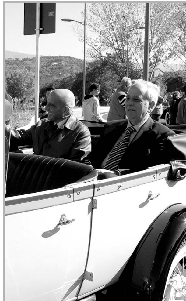
SIMBOLO Perugini e Bernaudo iale Parco, simbolo della continuità tra i Comuni di Cosenza e Rende

ROSAMARIA AQUINO r.aquino@calabriaora.it