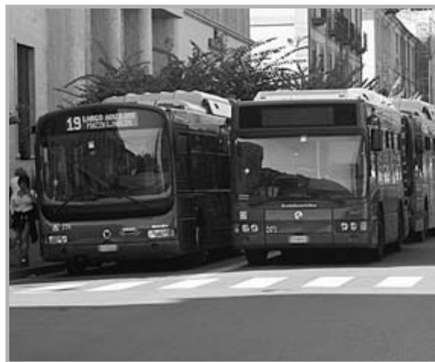
Bus dell'Amaco in corso Umberto