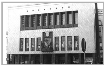
Il Comune di Cosenza

E' stata proclamata dai sindacati dopo il rinvio dell'incontro con il Comune previsto per ieri